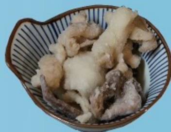
Deep fried pork guts ホルモン唐揚げ 580円税込638円