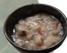
Octopus wasabi タコワサ