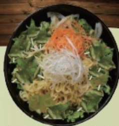
Noodle salad ラーメンサラダ