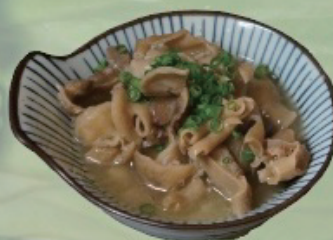
Gut Stew 自家製もつ煮