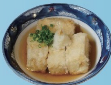
Deep fried tofu & soup 揚げ出し豆腐 680円税込748円