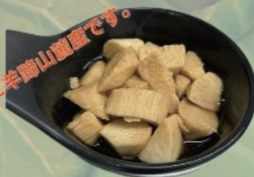
Yam potato soysoce 長芋醤油漬け