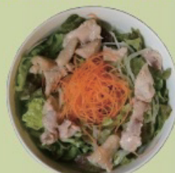
Chicken salad 蒸し鶏サラダ