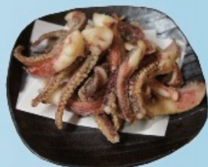
Deep fried squid leg イカゲソ揚げ 580円税込638円