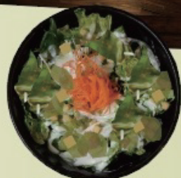
Ceaser salad シーザーサラダ