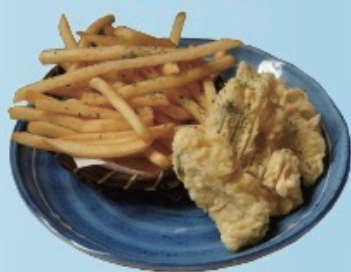
Fish&chips フィッシュ & チップス 680円税込748円