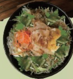
Tofu salad 豆腐サラダ