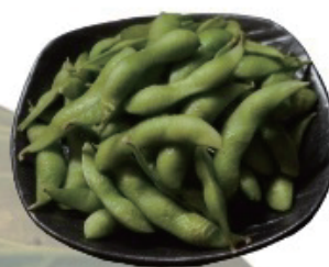
Edamame beans 枝豆