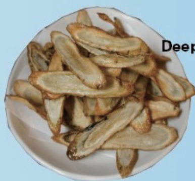
Deep fried gobo (burdock) ゴボウ唐揚げ 450円税込495円