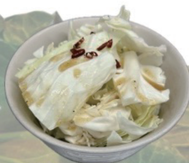
Fresh cabbage うまキャベツ