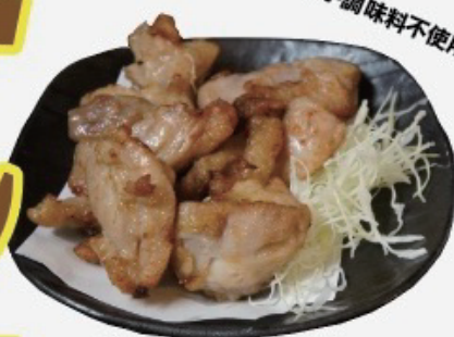
Deep fried rice chicken 自家製塩麹ザンギ 580円税込638円