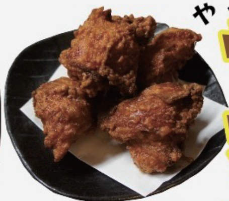
Deep fried chicken 自家製鶏ザンギ 580円税込638円