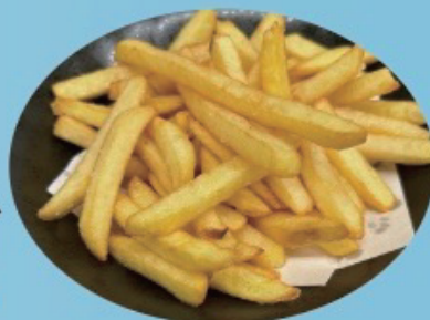
French fry ポテトフライ 450円税込495円