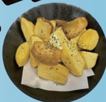
Deep fried kutchan potato 羊蹄山麓芋フライ 480円税込528円