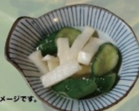
Pickeled vegetable 漬物