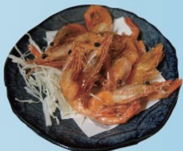
Deep fried shrimp 甘エビ唐揚げ 480円税込528円